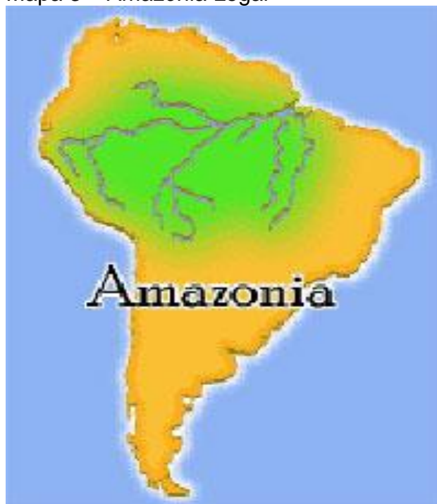
Mapa 3 – Amazônia Legal

Por outro lado, como já foi anteriormente abordado, o Estado colombiano não se encontra inerte ao quadro, refletindo os interesses da sociedade local pelos pressupostos conceituais, de instabilidade interna substanciando planos e ações que almejam alcançar a paz social. Por isso, torna-se relevante a discussão do planejamento colombiano com relação aos movimentos interno e a busca de soluções bem como a visão política da relação bilateral com o Brasil, cujos objetivos tendem ao associativismo continental que colabore para o restabelecimento da autonomia territorial. Principalmente porque a segurança interna vem fugindo do controle do Estado (CEBALLOS y MARTINI.2001) em algumas regiões do país desde 1970. Situação que se agravou pela crise econômica cuja redução da violência parece atualmente passar por uma forte negociação do governo com os grupos revolucionários que emergiram no contexto sócio-político, a Revolutionary Armed Forces a Colômbia (FARC) e a National Liberation Army (ELN), requerendo muita energia para que novamente seja legitimado o poder das